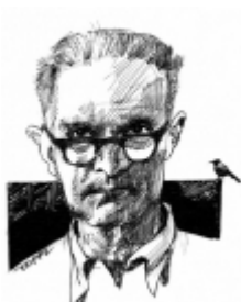
Sergio Toppi: Autoritratto